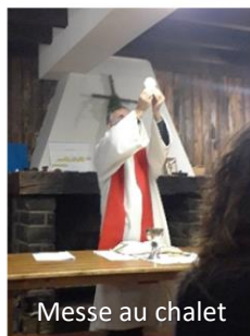
Messe au chalet

La prochaine parution de la feuille paroissiale sera le dimanche 20 mars 2022 Merci de faire parvenir au secrétariat vos annonces et intentions de messe au plus tard le mercredi 16 mars .