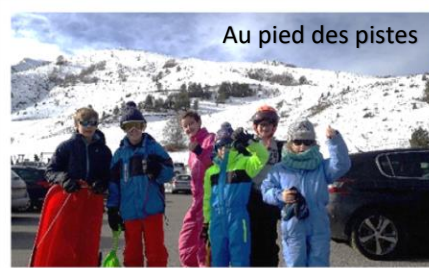
Au pied des pistes