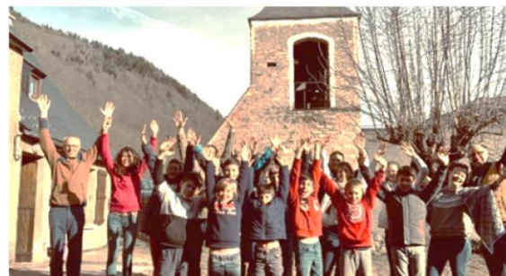
Vallée du Louron - Lac de Génos