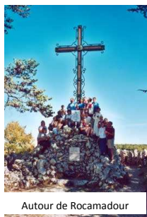
Autour de Rocamadour