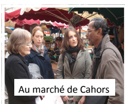
Au marché de Cahors